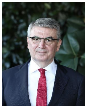
Πάνος Τσακλόγλου Υφυπουργός Κοινωνικών Ασφαλίσεων Υπουργείο Εργασίας και Κοινωνικής Ασφάλισης

SEIU Hellenic Association of Pharmaceutical Companies