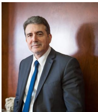
Μιχάλης Χρυσοχοΐδης Υπουργός Υπουργείο Υγείας

Ο Μιχάλης Χρυσοχοΐδης έχει πλούσια και ποικιλόμορφη εμπειρία στην πολιτική ασφάλειας, την ενέργεια, τις υποδομές, τις αγορές και το εμπόριο. Εξελέγη επίσης και υπηρέτησε ως Βουλευτής στο Ελληνικό Κοινοβούλιο. Διατέλεσε: Υπουργός Προστασίας του Πολίτη, Υποδομών, Μεταφορών και Δικτύων, Ανάπτυξης Ανταγωνιστικότητας και Ναυτιλίας και Υφυπουργός Ανάπτυξης και Εμπορίου. Είναι ο μακροβιότερος Υπουργός, αρμόδιος για θέματα εσωτερικής ασφάλειας, με θητείες που σηματοδοτήθηκαν από σημαντικά προγράμματα εκσυγχρονισμού της δημόσιας ασφάλειας, την καταπολέμηση της εγκληματικότητας, την αναμόρφωση της αντιτρομοκρατικής πολιτικής, την σύγχρονη οργάνωση των υπηρεσιών την ΕΛ.ΑΣ και την προστασία των συνόρων. Τα αποτελέσματα αυτής της πολιτικής συνδυάστηκαν με αντίστοιχες ευρωπαϊκές και διεθνείς συνεργασίες και περιλάμβαναν εφαρμογή προγραμμάτων εκπαίδευσης και κατάρτισης, ανταλλαγή πληροφοριών και τεχνολογική ενίσχυση της ΕΛ.ΑΣ.