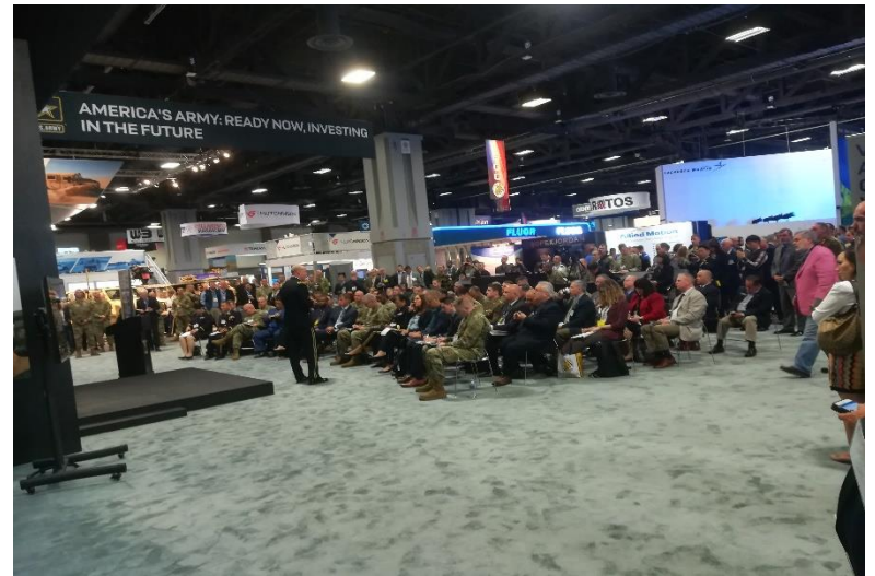
On Site Presentations