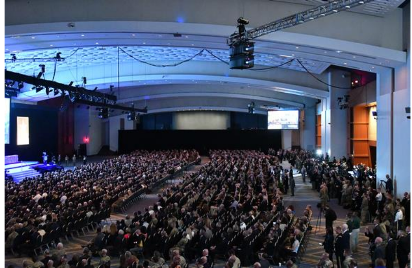
Official Inauguration Ceremony