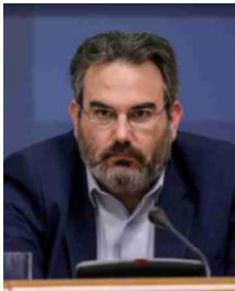
Ευθύμιος Μπακογιάννης Γενικός Γραμματέας Χωρικού Σχεδιασμού και Αστικού Περιβάλλοντος Υπουργείο Περιβάλλοντος και Ενέργειας

Ο Ευθύμιος Μπακογιάννης Δρ. Πολεοδόμος – Συγκοινωνιολόγος Μηχανικός, είναι επίκουρος καθηγητής στο Ε.Μ.Π.– ΣΑΤΜ, Τομέας Γεωγραφίας και Περιφερειακού Σχεδιασμού με 15 χρόνια εμπειρίας στο συντονισμό και στην υλοποίηση πολεοδομικών και κυκλοφοριακών μελετών, την επίβλεψη κατασκευής έργων και τις διαδικασίες χρηματοδότησης τους από την Ευρωπαϊκή Ένωση και άλλους χρηματοδοτικούς οργανισμούς. Έχει μετάσχει σε πλήθος μελετών και ερευνητικών προγραμμάτων χρηματοδοτούμενες από την Ε.Ε. ή Εθνικού Πόρους (Υπουργεία – Δήμους) σε περισσότερους από 50 Φορείς. Έχει συγγράψει δεκάδες επιστημονικά άρθρα και βιβλία στην Ελλάδα και στο Εξωτερικό, ενώ έχει συμμετάσχει σε περισσότερα από 100 συνέδρια ως ομιλητής με σχετική θεματολογία. Αξιοποιώντας τη διεθνή εμπειρία του έχει συμβάλει από διάφορες θέσεις στην προώθηση της βιώσιμης κινητικότητας στην Ελλάδα. Σήμερα είναι Γενικός Γραμματέας Χωρικού Σχεδιασμού και Αστικού Περιβάλλοντος του Υπουργείου Περιβάλλοντος και Ενέργειας. Περισσότερες πληροφορίες για το βιογραφικό στο www.bakogiannis.eu